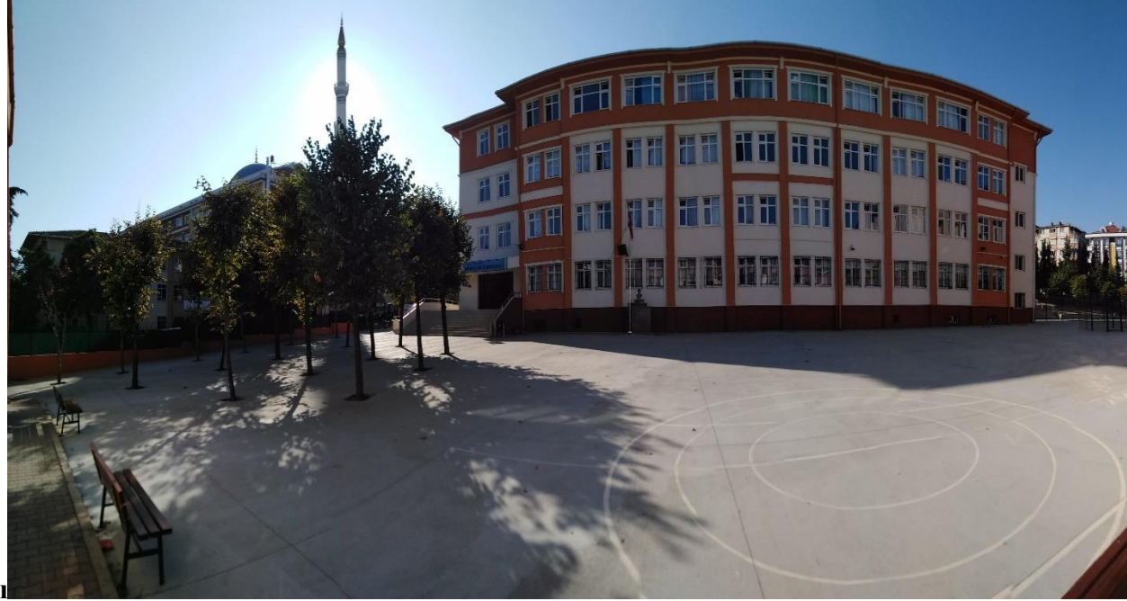
Okulun Kısa Tanıtımı

Durum analizi bölümünde okulumuzun mevcut durumu ortaya konularak neredeyiz sorusuna yanıt bulunmaya çalışılmıştır. Bu kapsamda okulumuzun kısa tanıtımı, okul künyesi ve temel istatistikleri, paydaş analizi ve görüşleri ile okulumuzun Güçlü Zayıf Fırsat ve Tehditlerinin (GZFT) ele alındığı analize yer verilmiştir.